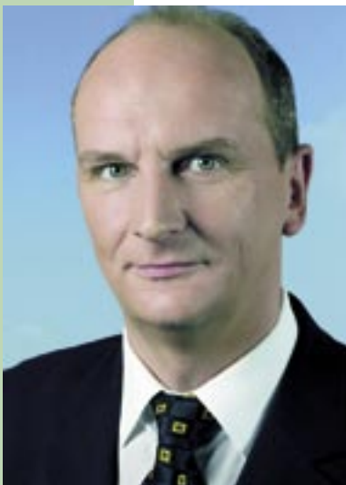
Dr. Dietmar Woidke

Liebe Leserin, lieber Leser, eine der wichtigsten bildungspolitischen Vorhaben der nächsten Jahre in Brandenburg ist der weitere Ausbau ganztagsschulischer Angebote.