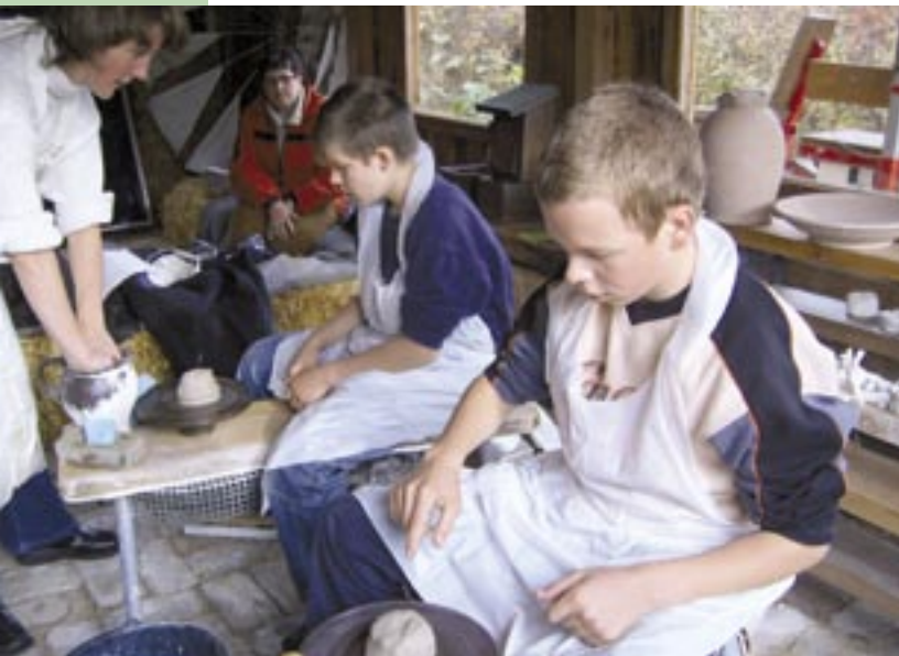
Jugendliche erlernen altes Handwerk

Die AG Jugendclub „Slawendorf“ wurde den Schülerinnen und Schülern der 8. Klasse angebo-