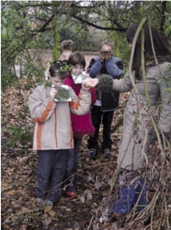
Und immer wieder: Perspektivenwechsel

tionsorientierten Zugang zum Themenkomplex „Umwelt“ ermöglichen. Ziel sollte es sein, durch experimentieren, erforschen und entdecken ökologische Zusammenhänge und naturwissenschaftliche Phänomene kennen zu lernen. Neben inhaltlichen, fächerübergreifenden Inputs sollten ganzheitliches und soziales Lernen im Vordergrund stehen. In Anlehnung an das naturpädagogische Konzept des Naturschutzhauses sollten die Kinder sich also spielerisch, forschend und sinnlich mit vielfältigen und der Jahreszeit angepassten Themen auseinandersetzen. Themen waren z. B. „Den Pflanzen und Insekten auf der Spur“, „Fledermäuse“, „Bäume und Sträucher im Herbst“, „Wetter“, „Tiere im Winter“, „Steine“ und „Licht & Dunkel“. Die methodische Bandbreite reichte dabei von Kennenlernspielen und Reflexionsübungen über Bewegungs- und Kooperationsspiele, Spiele zur sinnlichen Wahrnehmung, Lernen an Stationen, Experimente bis hin zu kreativen und praktischen Aktionen. Für die Durchführung standen uns flexible Lernorte in der Schule