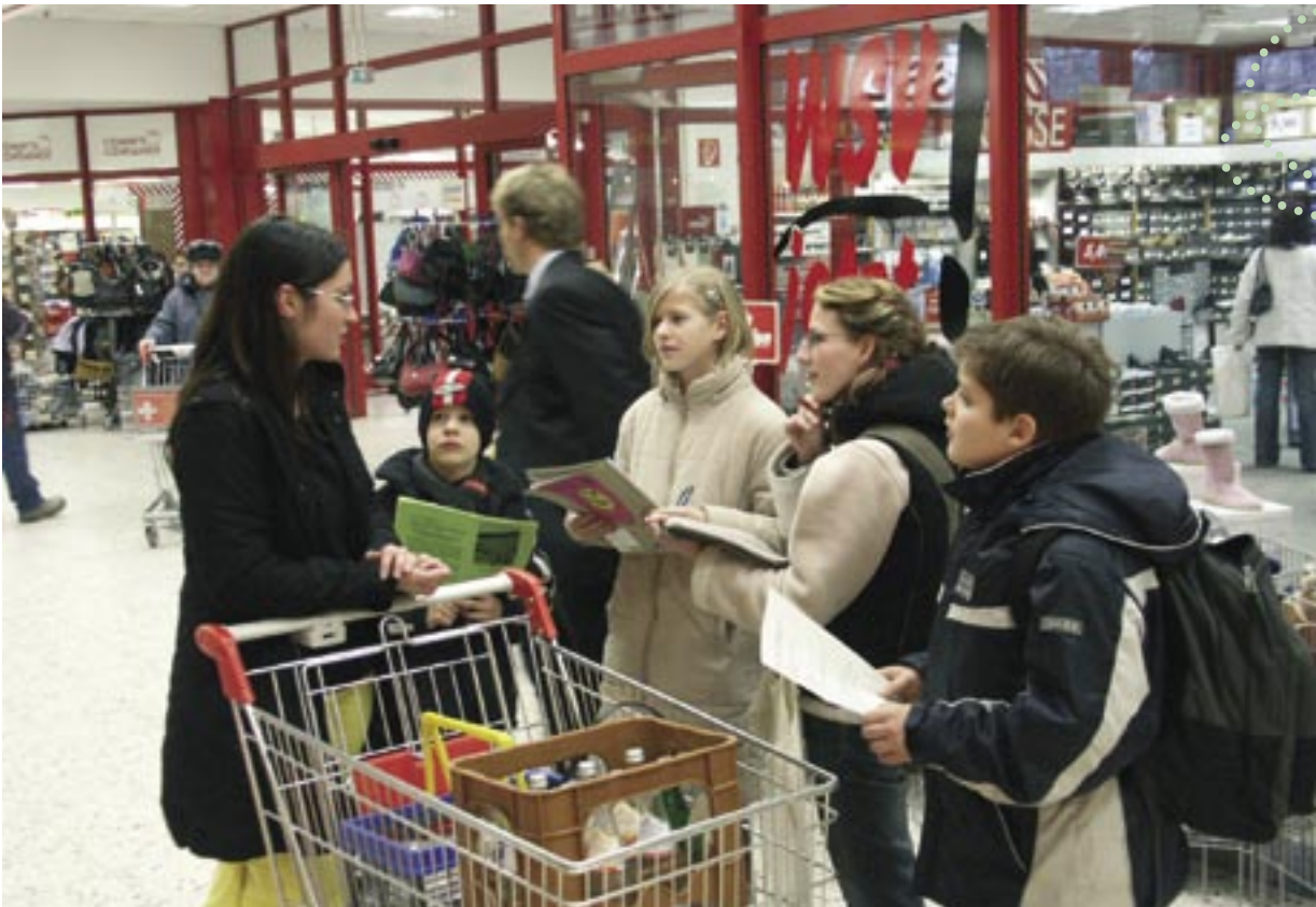
„Und wie halten Sie es mit Recyclingpapier?“ Schülerumfrage in der Einkaufspassage