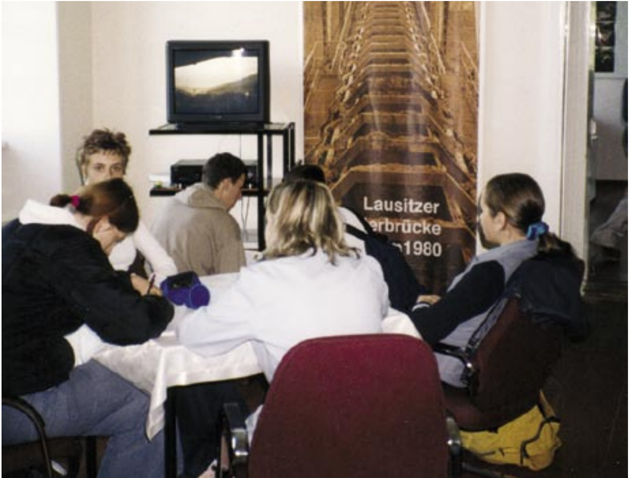
Lausitzer Braunkohle – Schüler und Schülerinnen analysieren die Auswirkungen des Tagebaus auf Natur und Gesellschaft.

welche durch die Vereinten Nationen ausgerufen wurde. Vor diesem Hintergrund soll das Transferprogramm auch bundesweit wichtige Impulse für die Weiterentwicklung der Bildung für eine nachhaltige Entwicklung geben.