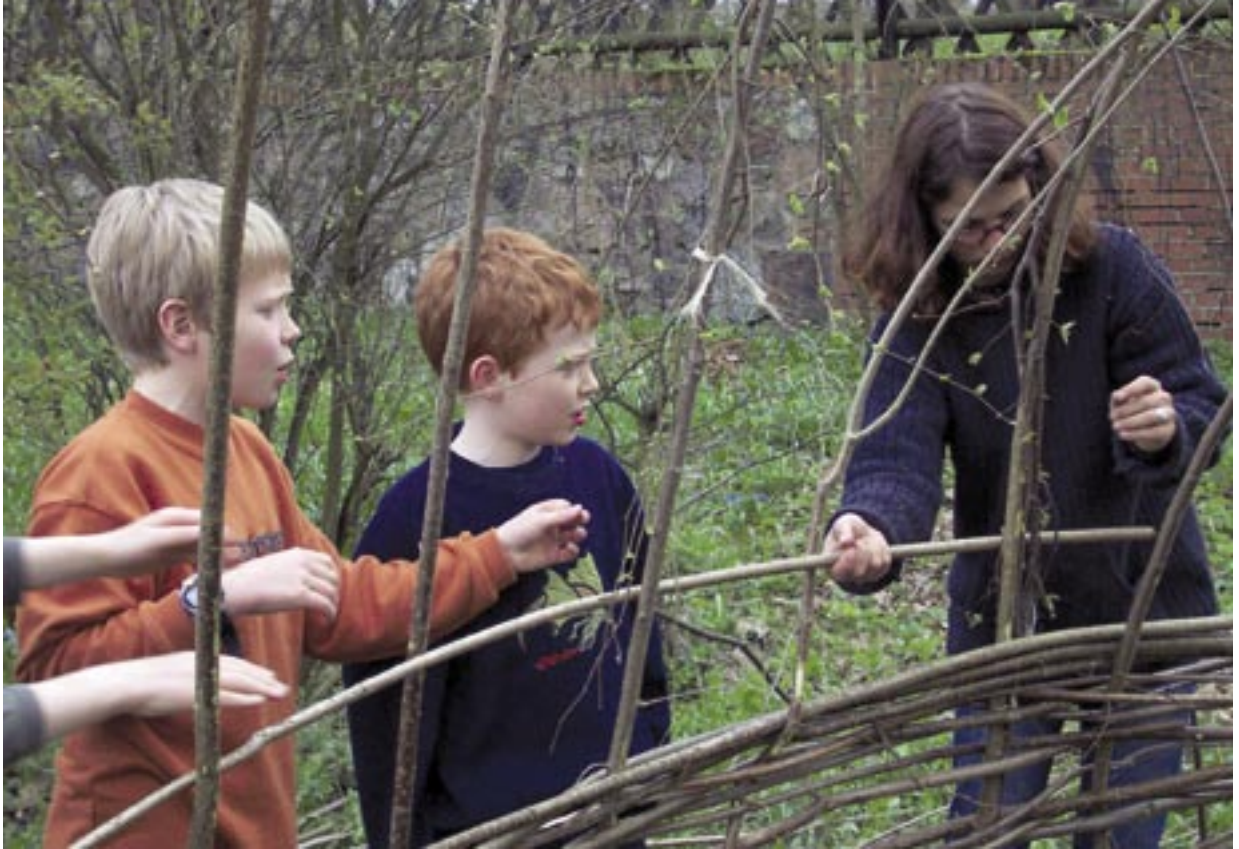
Schulhofgestaltung mit Weidenbau – Schüler und Schülerinnen legen Hand an

die eine nachhaltige Entwicklung ermöglichen. Bildung ist eine notwendige Voraussetzung, um die Menschen in die Lage zu versetzen, sich reflexiv mit den komplexen Umwelt- und Entwicklungsfragen auseinanderzusetzen, sich in dem Beziehungsgeflecht zu positionieren und daraus tragfähige Verhaltensweisen sowie bürgerschaftliches Engagement zu entwickeln.