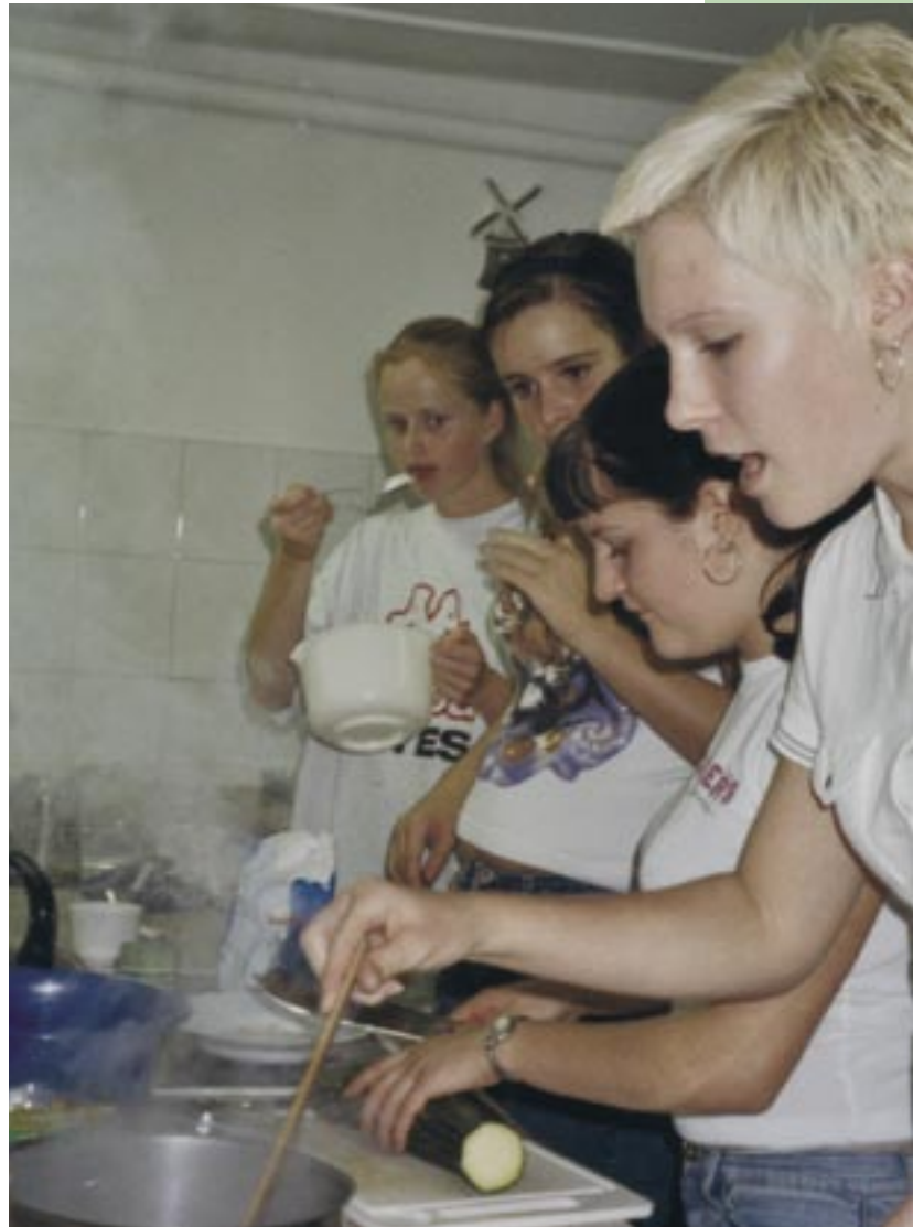
„Lets talk about food“ – Schülerkochstudio Gesunde Ernährung

das Themenfeld „Gesundheit – Was kann ich dafür tun“ Gegenstand des schulinternen Lehrplanes sein. Im Unterricht wird dann der Zusammenhang von Gesundheit und Ernährung behandelt. Unterrichtsinhalte sind auch die biologische Landwirtschaft, das Problem Genfood und worauf es bei „Bio-Essen“ ankommt. Im Unterricht infor-