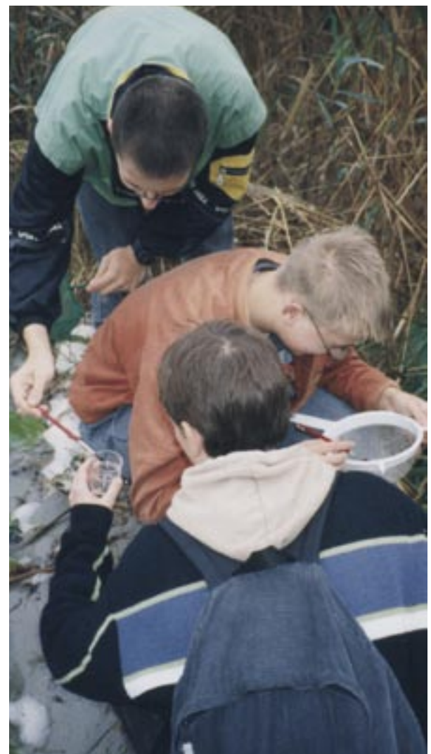
Wasser ist Leben – den Teichbewohnern auf der Spur

Wettbewerben und Aktionstagen. Schon bei den Jüngsten beginnt die Umwelterziehung mit der umweltfreundlichen Schultasche.