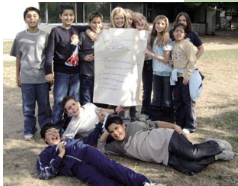
Die Umwelt-AG und ihre Gruppenregeln

In der Auswertung der AG in der letzten Stunde waren wir außerdem positiv überrascht, was den Teilnehmern und Teilnehmerinnen alles zu den einzelnen Themen einfiel und wie viel bei Ihnen „hängen“ geblieben war.