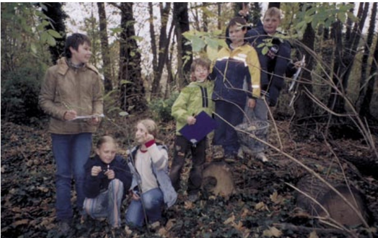
Bestandsaufnahme und Nummerierung der Jungerlen im Herbst

Ein Teilprojekt bestand in der Planung und Gestaltung eines Naturspielplatzes, der vorwiegend aus Naturmaterialien und kreativen Elementen bestehen sollte. Wichtig war dabei, die „Nutzer“, also Kinder und Jugendliche, von Anfang an der Umsetzung des Projektes zu beteiligen. Für den Entwurf konnte ein Landschaftsplanungsbüro aus Berlin gewonnen werden, das Erfahrung mit dieser Art des Arbeitens hatte. So kam es schon während der Planung des Spielplatzes im Kleinen-Spreewaldpark zum Kontakt mit den Schülerinnen und Schülern, die Ideen in Form von Zeichnungen und Skizzen für die Spielplatzgestaltung einbrachten. Im Oktober 1997 war es dann so weit – der Bau des Naturspielplatzes als erster Bauabschnitt des Parks wurde mit Schülerinnen und Schülern realisiert. Sie waren in Arbeitsgruppen unter Leitung fachkundiger Kräfte bei der Geländemodellierung, dem Bau des Weidentunnels und Weidenzaunes, der Bepflanzung und der Ansaat des Rasens beteiligt. Damals haben in insgesamt zwei Wochen ca. 500 Schülerinnen und Schüler der drei Schöneicher Schulen am Projekt mitgewirkt. Die Grund-