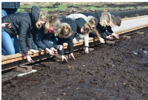
Abbildung 1: Moor mit allen Sinnen

einer sozial-ökologischen Transformation auch im Moorschutz besteht, muss geschaffen werden. „Moore“ als wissenschaftliches und alltägliches Thema sollte gesellschaftlich verankert werden. Es sollte klar sein, dass die nachhaltige Entwicklung von Moorlandschaften, Nachhaltigkeitskrisen (= Gesellschaftskrisen), Biodiversität, Klimawandel, Stoffe und Ressourcen betreffend, gemeinsam lösen kann. Damit ist nicht nur die Moorforschung, sondern auch die Moorpädagogik ein Baustein zur Lösung der Nachhaltigkeitskrisen.