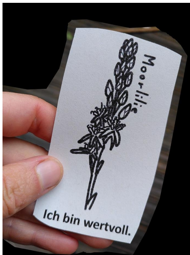
Abbildung 1: Affirmationskarte

Kopfnicken der Menschen denke, die ihre Karte für sich annehmen konnten.